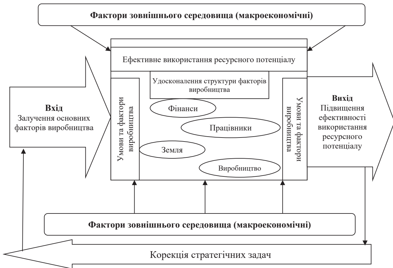
Рис. 2. Схема функціонування суб'єктів аграрного бізнесу з високою ефективністю використання ресурсного потенціалу

Для підприємств із низькою ефективністю використання ресурсного потенціалу – технічне переоснащення, інтенсифікація виробництва, освоєння ресурсозберігаючих технологій, пошук шляхів підвищення рівня ресурсного потенціалу.