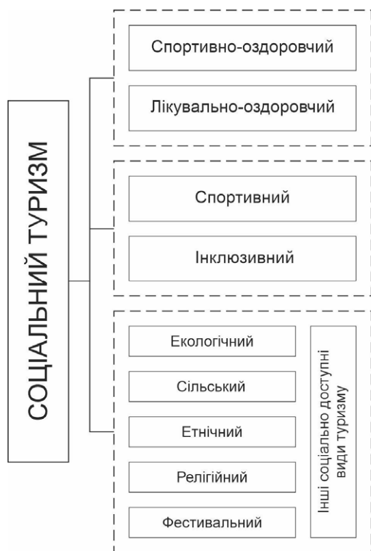
Рис. 2. Структура соціального туризму за організаційними особливостями

До іншого блоку, до організаційної структури соціального туризму ми відносимо спортивний та інклюзивний туризм, які також характеризуються наявністю специфічних вимог до матеріально-технічного та кадрового забезпечення, а саме, окрім наявності власне туристичного досвіду, є вимоги до відповід-